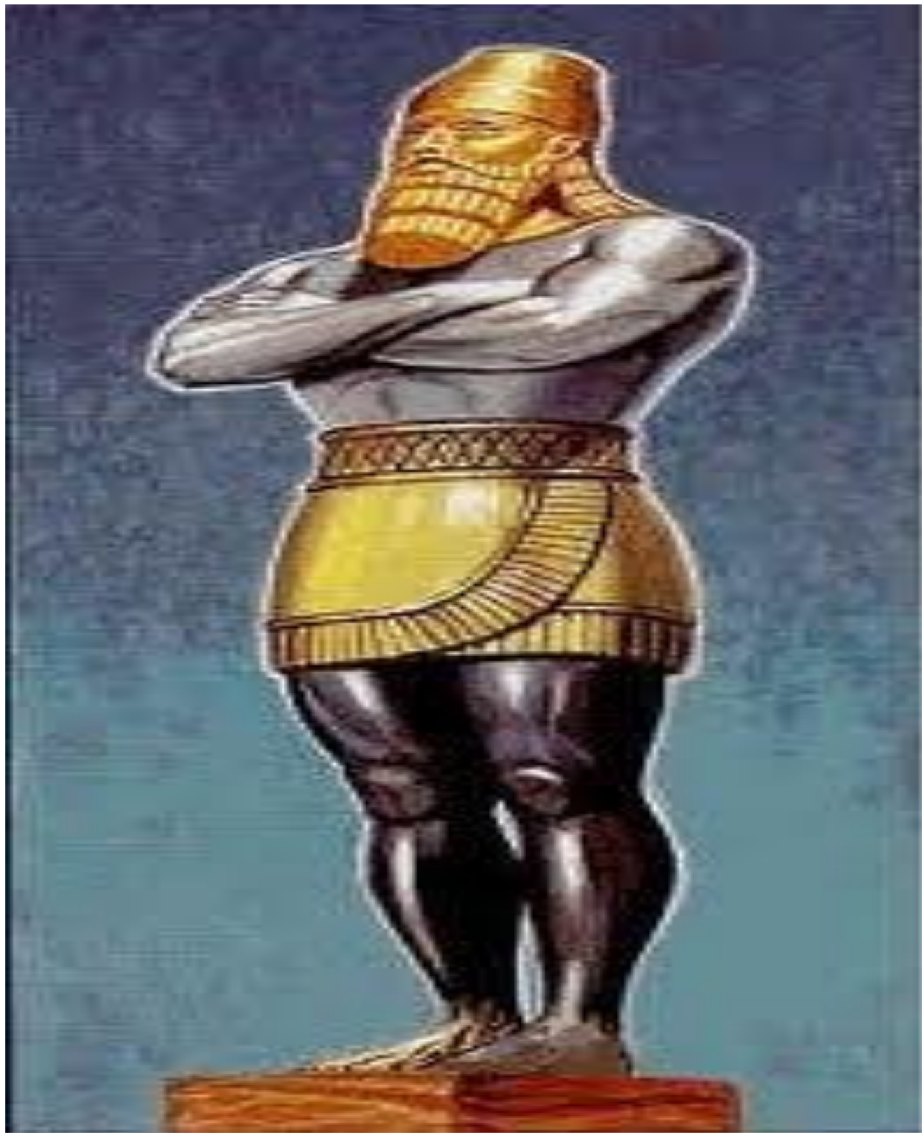
Cecil N Wright